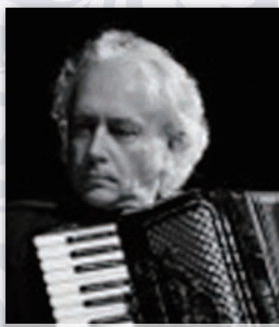
Romano Todesco ロマーノ・トデスコ 【アコーディオン奏者】