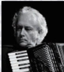
Romano Todesco ロマーノ・トデスコ 【アコーディオン奏者】